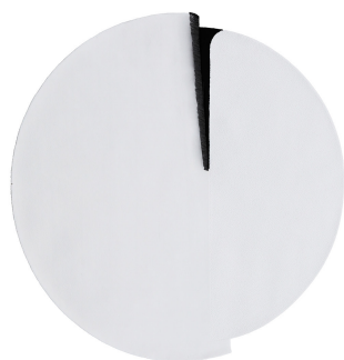
LAR 01 White Cut

I dati forniti in questa scheda tecnica sono aggiornati al momento della pubblicazione. Carpet Edition si riserva il diritto di modificare materiali, dimensioni e caratteristiche senza preavviso. The data provided in these technical specifications are up to date at the time of publication. Carpet Edition reserves the right to modify materials, sizes and characteristics without notice.