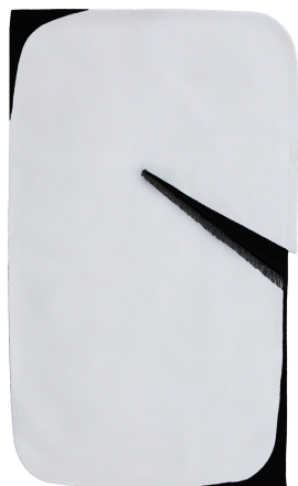
LA 01 White Cut

Disponibile su misura e in colori personalizzati Custom sizes and colors available